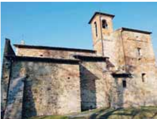
BRUSO di BORGONOVO - La chiesa priva di pluviali dopo il furto avvenuto all'inizio di febbraio: gli alpini, che hanno in cura la chiesa, hanno già avviato le procedure per rimpiazzarli