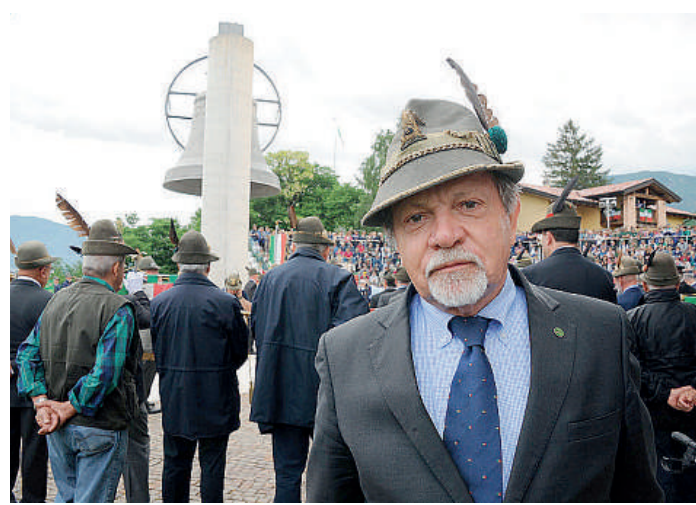
Roberto Migli, presidente nazionale del collegio dei revisori dei conti

Il fine settimana che sta per iniziare avrà una forte connotazione alpina, oltre alla seduta della giunta e del consiglio nazionale a Piacenza, da stasera a Cortemaggiore prende il via la 68esima edizione della Festa Granda, il raduno provinciale che si concluderà domenica. Un antipasto del grande evento che Piacenza ospiterà il 19 e il 20 ottobre quando, per la prima volta, arriveranno tutti gli alpini di Emilia Romagna