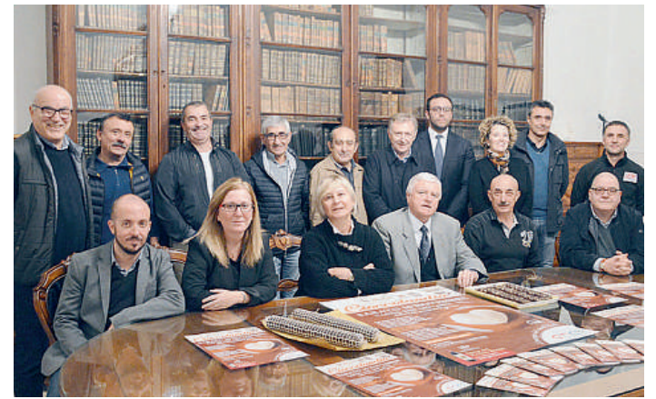
La conferenza stampa di presentazione di Cioccolandia