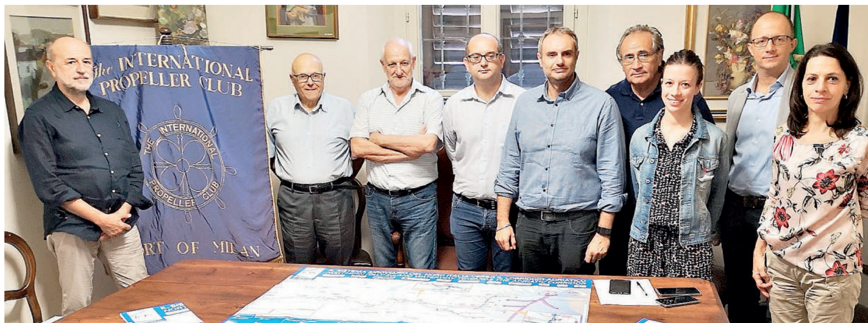
La presentazione dell'iniziativa si è tenuta in municipio a Monticelli ed è stato spiegato che il tratto da Isola Serafini a Cremona sarà percorso in bus

I cacciatori di Gropparello ricordano gli amici defunti