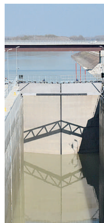
La conca di Isola Serafini

nibilità a collaborazioni future e Paolo Zilocchi della Only for you ha fatto altrettanto parlando di opportunità di partnership. Sono anche stati letti i messaggi inviati da alcuni amministratori locali che non hanno potuto essere presenti, come la consigliera comunale di Mantova Alessandra Cappellari, il presidente della Provincia di Mantova Beniamino Morselli e l'assessore regionale dell'Emilia Romagna Raffaele Donini, che ha così commentato: «Questa iniziativa è molto importante perché dimostra quanto la navigazione interna sul fiume Po possa rappresentare non solo un'importante idrovia per il traffico delle merci, ma anche un'opportunità per la navigazione turistica. Insieme alle Regioni Veneto, Lombardia e Piemonte ci stiamo impegnando per costruire attorno alla navigazione interna del Po un progetto strategico che comprenda i nostri territori, per aumentarne l'attrattiva e la competitività».