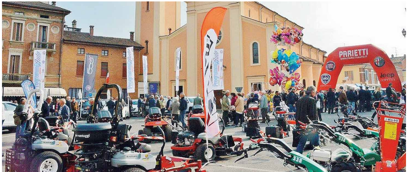
Anche quest'anno si rinnova l'esposizione delle macchine agricole

L'inaugurazione ufficiale è prevista per le ore 10, e sarà accompagnata dall'esibizione del Gruppo Folkloristico Musicale "la Coppa". Riapriranno le mostre d'arte e avranno un loro spazio nel centro storico, tutte le associazioni di volontariato del paese. Durante la mattinata riaprirà lo stand gastronomico della società di pesca "Fario", in via Veneto. Alle ore 11 è prevista l'inaugurazione della seconda edizione di "Street Food d'autore" con orario continuato sino alle ore 20.