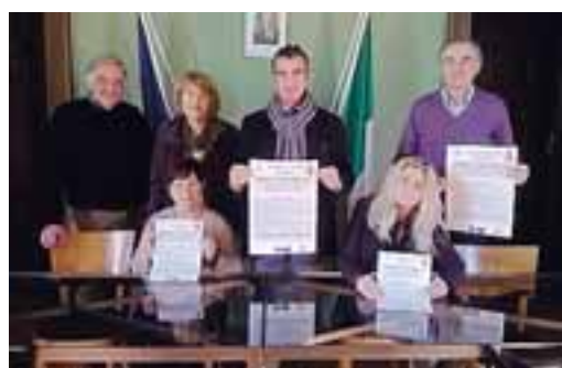
PIANELLO - Presentata ieri mattina la festa del copatrono San Colombano

pariamo organizzando la festa, momento per riconoscere chi si è distinto nel lavoro e nello studio, che erano le due regole su cui si basava il pensiero di San Colombano». Quest'anno saranno premiate le associazioni che tanto lavorano a favore del territorio. «Grazie a loro - ha detto Castellini - ogni anno riusciamo ad organizzare eventi e manifestazioni con fini anche benefici». Le associazioni premiate sono: Avis, Una scuola da Favola, Artiglieri, Alpini, Arma Aeronautica, Asd Valtidone, Centro sociale anziani e Pianello frizzante (che orga-