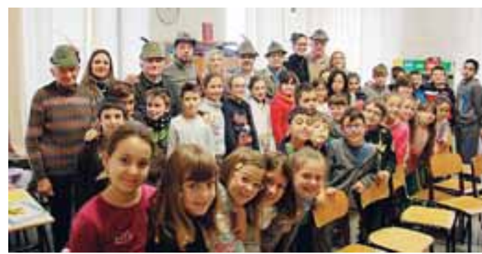
AGAZZANO - Gli alpini con i bambini in classe

AGAZZANO - Che significato ha la penna sul cappello? Che cosa fanno oggi nel mondo e quale è la loro storia? In una parola "Ma chi sono questi alpini?". Era questo il titolo del video che i piccoli scolari delle ultimi tre classi della scuola elementare di Agazzano hanno potuto visionare insieme alle maestre e ad alcuni ospiti d'eccezione. Con loro tra i banchi si è infatti seduta una piccola delegazione di penne nere in rappresentanza dei gruppi alpini di Agazzano e più in generale della Valtidone e Valluretta. In dono agli scolari agazzanesi gli alpini hanno portato un regalo speciale e cioè un cd che racconta la loro storia, e quindi il loro passato glorioso e il loro spirito solidaristico, ma anche il presente fatto ad esempio di tante missioni di pace nel mondo e progetti a favore di chi ha più bisogno, e del futuro che ha il volto dei giovani che si avvicinano a questa realtà. Il video è stato proiettato durante la mattinata cui ha preso parte, tra gli altri, Carlo Veneziani che è alpino re-