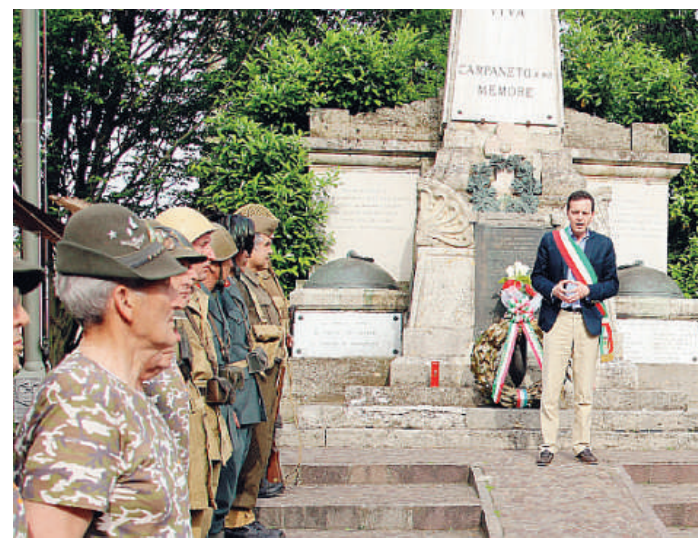
Una manifestazione davanti al monumento ai Caduti nel centro del paese