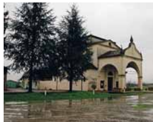
Una veduta del piazzale del cimitero prima dei lavori di sistemazione