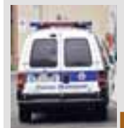
Sul posto anche la polizia municipale

hanno cercato di fermare il ventunenne. Dal momento che il ragazzo sembrava scatenato, in aiuto della giovane e degli agenti della polizia municipale, è intervenuto un alpino. Ne è seguito un parapiglia nel corso del quale l'ecuadoriano avrebbe sferrato un pugno sulla bocca del giovane alpino. Sul posto sono poi accorse altre pattuglie della polizia municipale che hanno immobilizzato lo straniero. L'alpino sanguinante ha dovuto ricorrere alle cure del pronto soccorso, se la caverà con pochi giorni di pro-