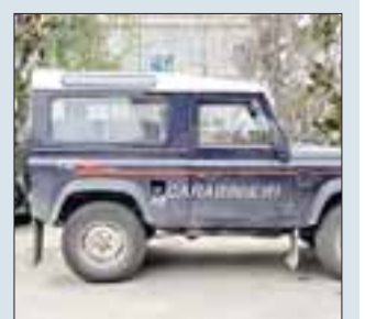
Intervento dei carabinieri