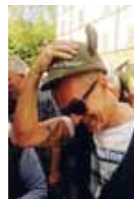
Un nuovo Alpino