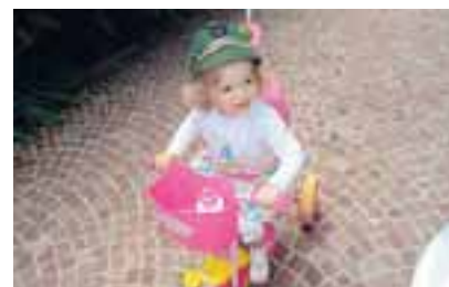
Alice col suo trabiccolo all'adunata degli Alpini (Pietro Gandolfi)