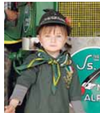
Marty, presente all'adunata! (sabrymilza)